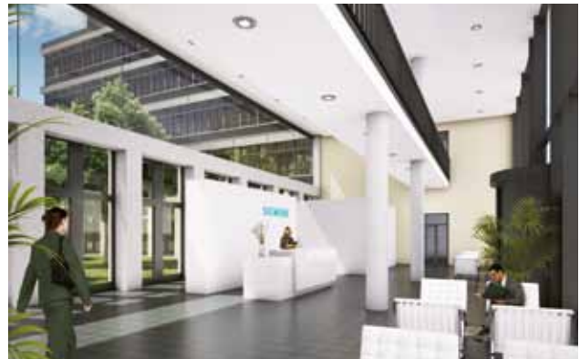
Willkommen bei Siemens Düsseldorf Visualisierung des Eingangsbereichs

Unternehmen bevorzugen gut angebundene Standorte, hiervon profitiert die neue Airport City. Das 230.000 m 2 große Quartier ist Standort der Fondsimmoblie. Die Lage besticht durch ihre direkte, fußläufige Nachbarschaft zu dem Flughafen terminal und beste verkehrstechnische Anbindungen über Straße wie Schiene.